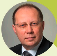
Prof. Dr. med.